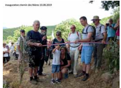
Inauguration chemin des Nières 10.08.2019

À partir de la chapelle, comment continuer le parcours ? Prendre le chemin qui, à droite, descend rejoindre la route de Castanet au Buis et remonter celle-ci. Avant d'arriver au Buis, prendre à gauche la piste qui