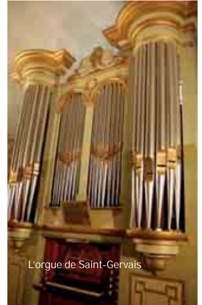
L'orgue de Saint-Gervais

En 2025, le CEPO proposera gratuitement un spectacle aux scolaires de Saint-Gervais, ouvert aux classes de l'école élémentaire ainsi que de 6 e du collège. D'autres animations sont prévues sur Grand Orb et l'église de Saint-Gervais sera le cadre d'un concert orgue-saxo.