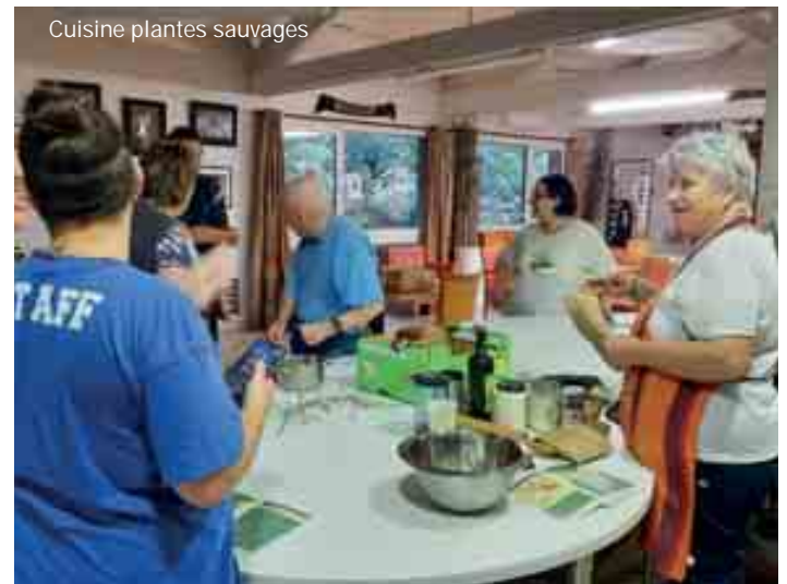
Cuisine plantes sauvages

Du côté des adultes, ce sont surtout des bénévoles qui ont proposé et animent les activités : conversation franco-anglaise, scrapbooking, couture (adultes, et ados depuis septembre), tricot, cuisine des plantes sauvages. En octobre un atelier danse en cercle a commencé à se mettre en place. L'atelier poterie, malgré son succès, a été interrompu fin juin, du moins sous sa forme actuelle, c'est-à-dire en partie pris en charge par Grandir Ensemble.