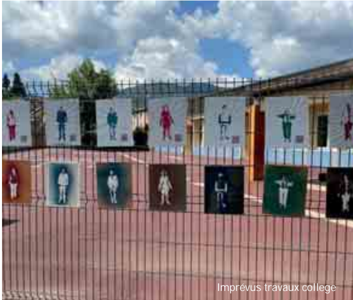
Imprévis travaux college