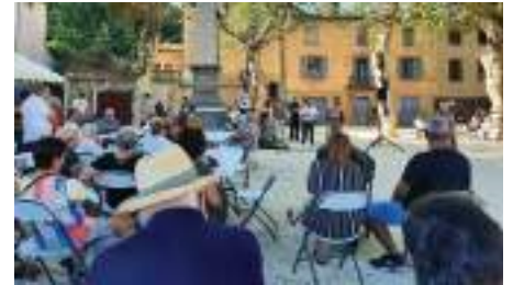
Apéro en musique

Nous vous souhaitons une belle année, riche de moments conviviaux.