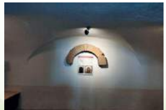
Réaménagement de la salle archéologique Côté claveaux