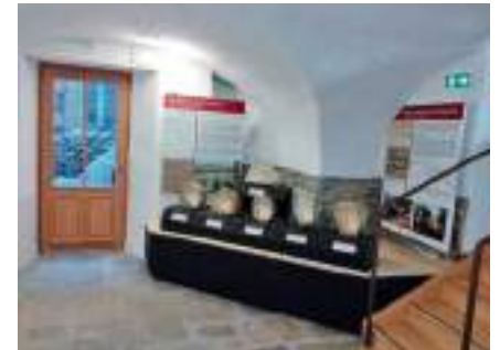
Réaménagement de la salle archéologique Côté St Laurent