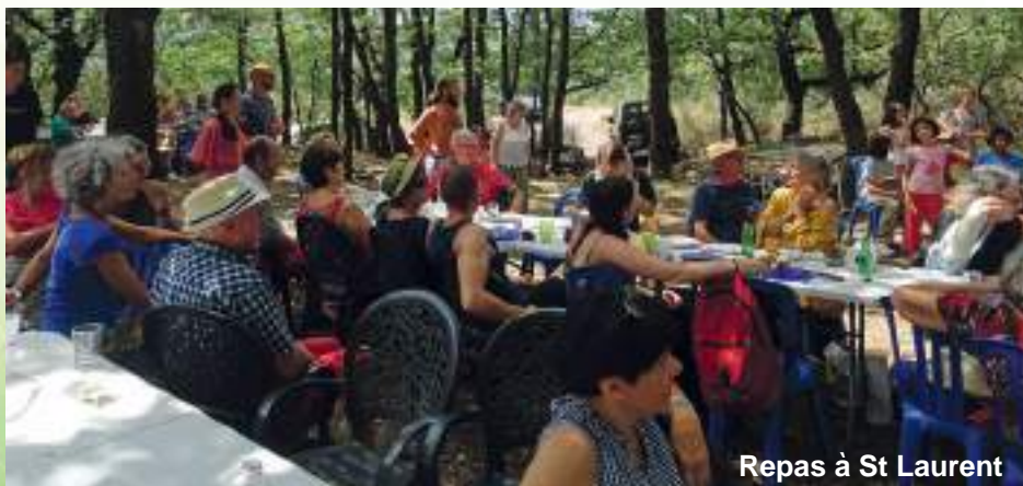
Repas à St Laurent

- L'année s'est terminée dans la joie, autour du réveillon de l'amitié.