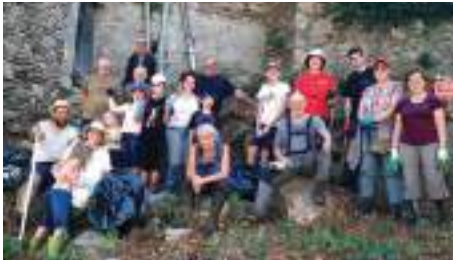
L'équipe des nettoyeurs de rivière