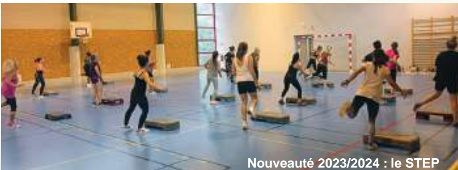
Nouveauté 2023/2024 : le STEP

Nous vous souhaitons une année active et sportive. Pour tout renseignement, n'hésitez pas à nous contacter par mail sportsaucanton@gmail.com ou par téléphone au 06 76 60 50 09. Vous pouvez également nous rejoindre sur notre page Facebook.