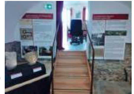
Réaménagement de la salle archéologique Côté escaliers